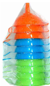
Art. 54.180.0320 Imbuto in plastica con filtro Ø cm. 12 Colori assortiti Plastic funnel with filter - Ø = 12 cm. Mixed colours