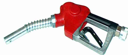
Art. 54.230.0030 Pistola da travaso con ARRESTO AUTOMATICO • corpo in alluminio c/raccordo girevole • senza raccordo di entrata (foro Ø 1") • Erogazione 60 lit/min Automatic aluminium fuel gun