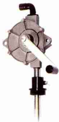
54.230.0071 Pompa da travaso rotativa per fusti • indicata per gasolio olio e kerosene • fornita completa di tubo di pesca rigido • erogazione litri al minuto 70 lit / mi Ø Corpo 125 mm • Rotary transfer pump for drums