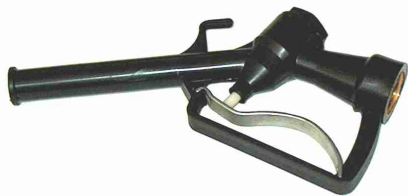
Art. 54.230.0029 Pistola da travaso in PLASTICA • Senza raccordo di entrata (foro Ø 3/4") • Erogazione 60 lit/min Plastic fuel gun