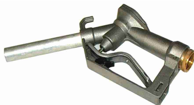
Art. 54.230.0028 Pistola da travaso in ALLUMINIO • con raccordo girevole • senza raccordo di entrata (foro Ø 1") • Erogazione 60 lit/min Aluminium fuel gun