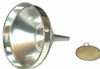
Art. 54.180.0310 Imbuto in metallo completo di filtro Ø 24 cm con gambo rigido Metal Oval Funnel with filter and rigid shank