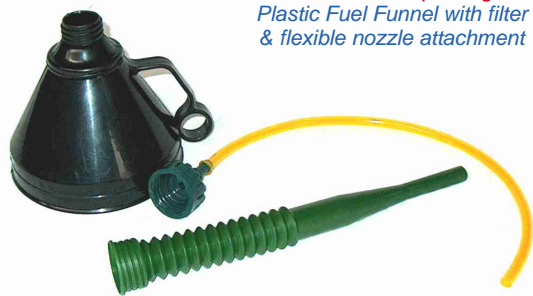
Art. 54.180.0321 Kit Imbuto in plastica include: • manico • filtro • gambo flessibile • raccordo con prolunga Plastic Fuel Funnel with filter & flexible nozzle attachment