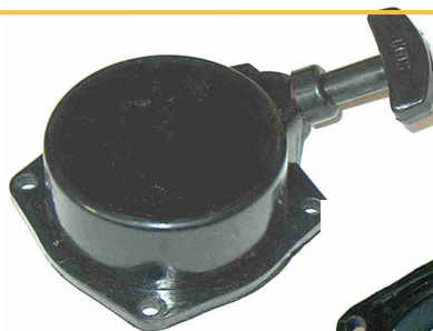
Art. 54.160.2312 Gruppo avviamento completo adattabile a: Starter Assembly Fits: MITSUBISHI T200