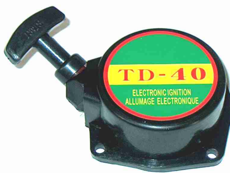
Art. 54.160.2312 Gruppo avviamento completo adattabile a Complete Starter Assembly Fits: KAWASAKI TD40 - TD48