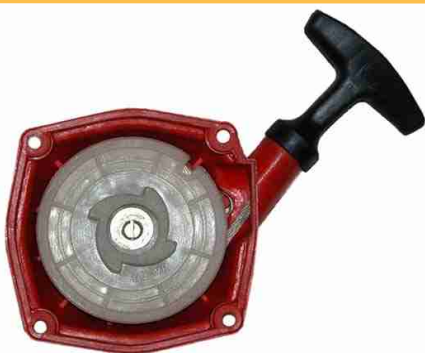
Art. 54.160.2320 Gruppo avviamento completo adattabile Complete Starter Assembly Fits: ALPINA CASTOR: VIP 42 VIP 52