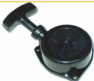
Art. 54.160.2308 Gruppo avviamento adattabile completo Starter Assembly Fits: MITSUBISHI TL 23 / TL 26