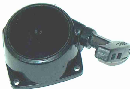
Art. 54.160.2350 Gruppo avviamento completo adattabile a Starter Assembly fits: ZENOAH • BC435 • BC 534 • BC 535 • BK 436 • BK 531 • BK 5300