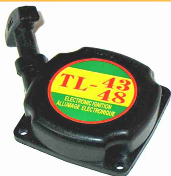
Art. 54.160.2310 Gruppo avviamento completo adattabile a: Complete Starter Assembly Fits: MITSUBISHI TL 33 - TL 43 - TL 52 VECCHIO MODELLO/ OLD MODEL