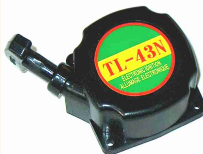
Art. 54.160.2311 Gruppo avviamento completo Complete Starter Assembly Fits: MITSUBISHI TL33 - TL43 - TL52 NUOVO MODELLO/ NEW MODEL