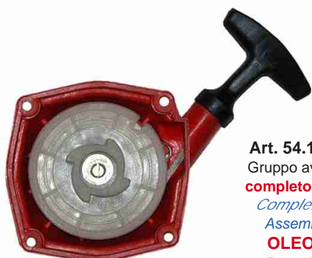
Art. 54.160.2321 Gruppo avviamento completo adattabile Complete Starter Assembly Fits: OLEO-MAC 750 - 753 - 755