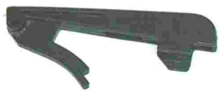
Art. 54.190.1540 Leva disinnesto acceleratore adattabile a Trigger control lever to fit Husq. 51 - 55