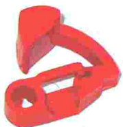
Art. 54.190.1545 Leva STOP adattabile a STOP lever to fit Husq. 340 - 340e- 345e - 350