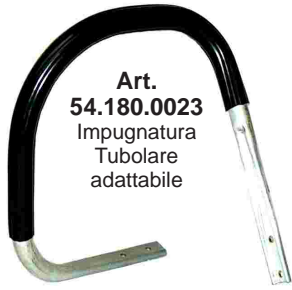
Art. 54.180.0023 Impugnatura Tubolare adattabile

HANDLE BARS TO FIT THE FOLLOWING CHAINSAW BRANDS