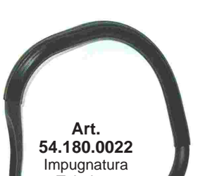
Art. 54.180.0022 Impugnatura Tubolare adattabile Handle bar replaces STIHL 034 • 036