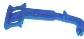
Art. 54.190.1544 Levetta aria adattabile a Air-Choke lever to fit Husq. 340 - 340e- 345e-350