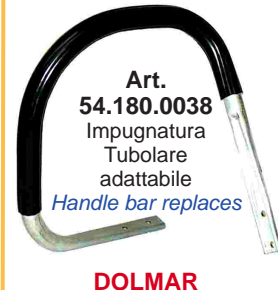
Art. 54.180.0038 Impugnatura Tubolare adattabile Handle bar replaces DOLMAR 153