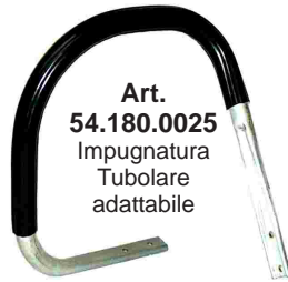
Art. 54.180.0025 Impugnatura Tubolare adattabile