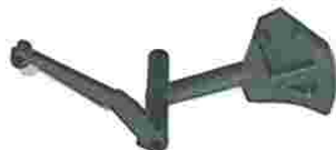
Art. 54.160.2402 Grilletto acceleratore adattabile a Trigger lever replaces Husq. 162