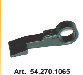
Art. 54.270.1065 Supporto per impugnatura tubolare adattabile a Handle bar support replaces: STIHL 08