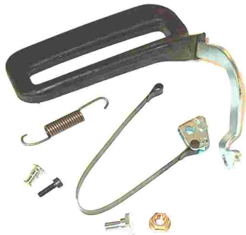
Art. 54.120.0609 Kit frenocatenata adattabile a Chain brake kit fits Dolmar 133