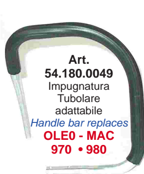
Art. 54.180.0049 Impugnatura Tubolare adattabile Handle bar replaces OLEO - MAC 970 • 980