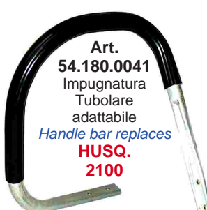
Art. 54.180.0041 Impugnatura Tubolare adattabile Handle bar replaces HUSQ. 2100