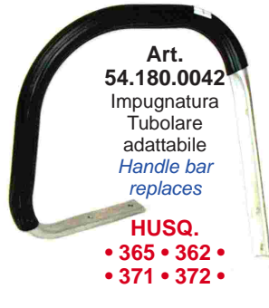
Art. 54.180.0042 Impugnatura Tubolare adattabile Handle bar replaces HUSQ. • 365 • 362 • • 371 • 372 •