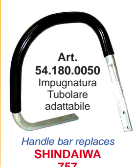
Art. 54.180.0050 Impugnatura Tubolare adattabile Handle bar replaces SHINDAIWA 757