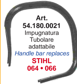
Art. 54.180.0021 Impugnatura Tubolare adattabile Handle bar replaces STIHL 064 • 066