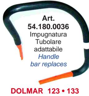
Art. 54.180.0036 Impugnatura Tubolare adattabile Handle bar replaces DOLMAR 123 • 133