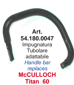
Art. 54.180.0047 Impugnatura Tubolare adattabile Handle bar replaces McCULLOCH Titan 60