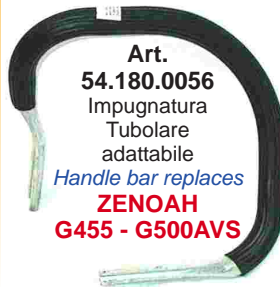
Art. 54.180.0056 Impugnatura Tubolare adattabile Handle bar replaces ZENOAH G455 - G500AVS