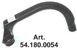
Art. 54.180.0054 Impugnatura Tubolare adattabile Handle bar replaces ZENOAH G 2500