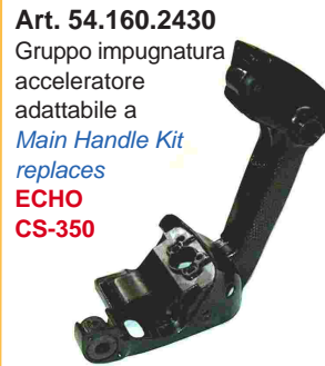
Art. 54.160.2430 Gruppo impugnatura acceleratore adattabile a Main Handle Kit replaces ECHO CS-350