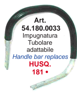
Art. 54.180.0033 Impugnatura Tubolare adattabile Handle bar replaces HUSQ. 181 •