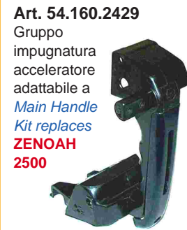
Art. 54.160.2429 Gruppo impugnatura acceleratore adattabile a Main Handle Kit replaces ZENOAH 2500