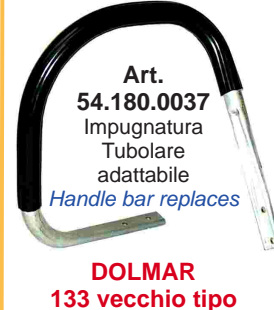
Art. 54.180.0037 Impugnatura Tubolare adattabile Handle bar replaces DOLMAR 133 vecchio tipo (old type)