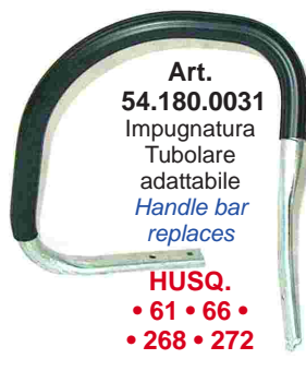
Art. 54.180.0031 Impugnatura Tubolare adattabile Handle bar replaces HUSQ. • 61 • 66 • • 268 • 272