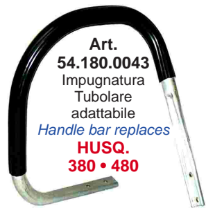
Art. 54.180.0043 Impugnatura Tubolare adattabile Handle bar replaces HUSQ. 380 • 480