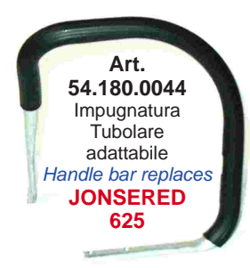
Art. 54.180.0044 Impugnatura Tubolare adattabile Handle bar replaces JONSERED 625