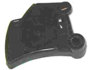
Art. 54.230.0041 Placchetta acceleratore adattabile a Trigger lever replaces Dolmar 133