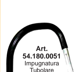
Art. 54.180.0051 Impugnatura Tubolare adattabile Handle bar replaces STIHL 08