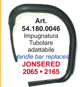
Art. 54.180.0046 Impugnatura Tubolare adattabile Handle bar replaces JONSERED 2065 • 2165