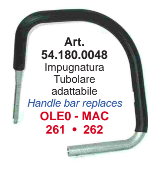
Art. 54.180.0048 Impugnatura Tubolare adattabile Handle bar replaces OLEO - MAC 261 • 262