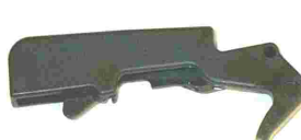
Art. 54.190.1542 Leva disinnesto acceleratore adattabile a Trigger control lever to fit Husq. 365