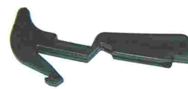
Art. 54.190.1543 Leva disinnesto acceleratore adattabile a Trigger control lever to fit Husq. 61 - 272