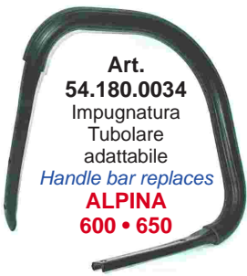
Art. 54.180.0034 Impugnatura Tubolare adattabile Handle bar replaces ALPINA 600 • 650

HANDLE BARS TO FIT THE FOLLOWING CHAINSAW BRANDS