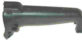
Art. 54.180.0060 Impugnatura principale adattabile a Main handle replaces Dolmar 133