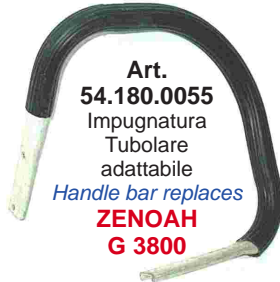
Art. 54.180.0055 Impugnatura Tubolare adattabile Handle bar replaces ZENOAH G 3800