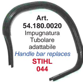
Art. 54.180.0020 Impugnatura Tubolare adattabile Handle bar replaces STIHL 044