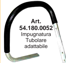
Art. 54.180.0052 Impugnatura Tubolare adattabile