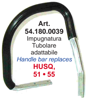
Art. 54.180.0039 Impugnatura Tubolare adattabile Handle bar replaces HUSQ. 51 • 55