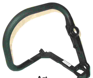
Art. 54.180.0029 Impugnatura Tubolare adattabile Handle bar replaces STIHL 029 • MS 290 039 • MS 390 MS 310