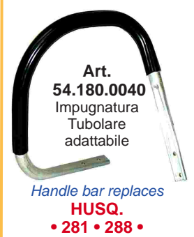
Art. 54.180.0040 Impugnatura Tubolare adattabile Handle bar replaces HUSQ. • 281 • 288 •