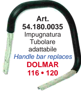
Art. 54.180.0035 Impugnatura Tubolare adattabile Handle bar replaces DOLMAR 116 • 120