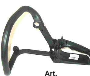
Art. 54.180.0027 Impugnatura Tubolare adattabile Handle bar replaces STIHL 017 • MS 170 • 018 • MS 180