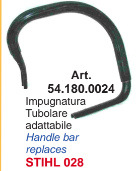
Art. 54.180.0024 Impugnatura Tubolare adattabile Handle bar replaces STIHL 028