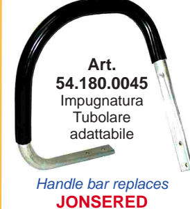
Art. 54.180.0045 Impugnatura Tubolare adattabile Handle bar replaces JONSERED 2041